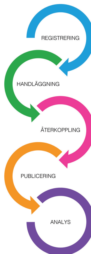
Process för klagomåls-/synpunktshantering.

Burlövs kommun, Markaryds kommun, Mölndals stad, Sigtuna kommun, Värmdö kommun, Bräcke Diakoni.